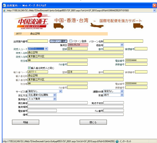
出荷案内詳細入力